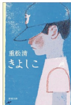
『きよしこ』 重松 清著

どこにでもいる少年。転校生。言いたいことがいつも言えずに、悔しかった。思ったことを何でも話せる友だちが欲しかった。そんな友だちは夢の中の世界にしかいないことを知っていたけど。ある年の聖夜に出会ったふしぎな「きよしこ」は少年に言った。伝わるよ、きっと。大切なことを言えなかったすべての人に捧げたい珠玉の少年小説です。 (アマゾンより)