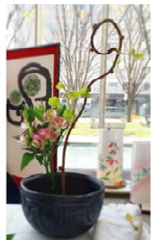
自力で作った作品

先日、得意先の先生が講師をされている一光流の展示会で3年ぶり2度目の生け花に挑戦しました。3年前は何をどうしてよいのか頭が真っ白になり、そのまま挿しただけでしたが、今回は、開き直って無心に作品をつくることができました。