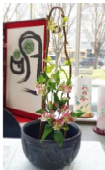
家元の手直しいただいた作品